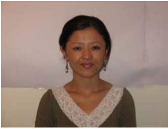
སྐལ་བཟང་བདེ་སྐྱིད་ལགས།