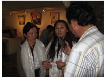
བསོད་ནམས་དང་སྐལ་བཟང་གསར་འགོད་ མཉམ་བཞུག་འཕྲིན་ལྷན་པ།

དབུས་བྱུང་མེད་ལྷན་ཚོགས་ཀྱིས་བྱུང་མེད་རི་མོ་བ་བསོད་ནམས་ལྷ་མོ་དང་སྐལ་བཟང་བདེ་སྐྱིད་ལགས་སུ་འདྲི་བ་ དྲི་ལན་གནང་དོན།